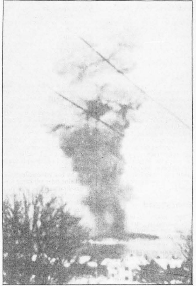
Røyksoyle over Østøya 21. januar 1945 etter at et tysk torpedo lager er blåst til himmels.

Vestfold var et viktig område for tyskerne. Hver knaus blei bygd ut til forsvarstilling. Fylket utgjorde en av landets viktigste forsvarstillinger mot truede engelske angrep, det hadde den viktige tyske kabelforbindelsen til Danmark, og 4-timers ferja fra Larvik til Danmark. Tyske militære disposisjoner av noen betydning måtte derfor uunnvælig berøre Vestfold. Allerede sommeren og høsten 1940 fikk befolkningen tydelig demonstrert dette. Fra 24.august begynte staben til general Falkenhorst å planlegge operasjon «Herbstreise», som omfattet utskippingen av tre infanteridivisjoner fra Sør-Norge, til angrep mot Nord-England og Skottland. En av dem skulle innkipes i Vestfold, og som forberedelser blei havneområder avsperrert, befolkningen flyttet fra sensitive områder, mistenkelige arrestert. «Herbstreise» var i vir-